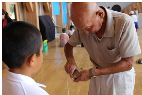
9/20 奈古高齢会さん来校! 4年生と昔の遊びで交流!

9~10月の子どもたちの様子や主なイベントの中から、「この日の1枚」を厳選してご紹介いたします。