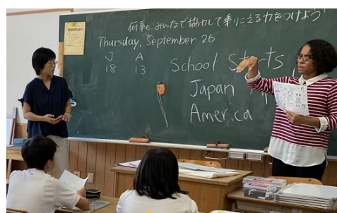
9/26 福賀小との交流 宿泊学習に合わせて交流!