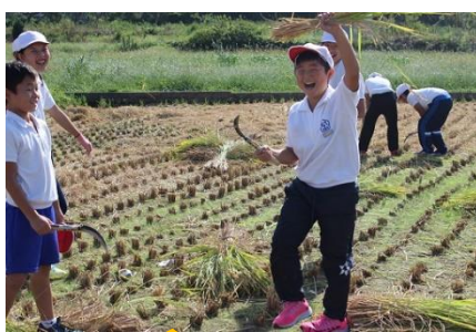
10/4 稲刈り15年 慣れた手つきで大収穫!