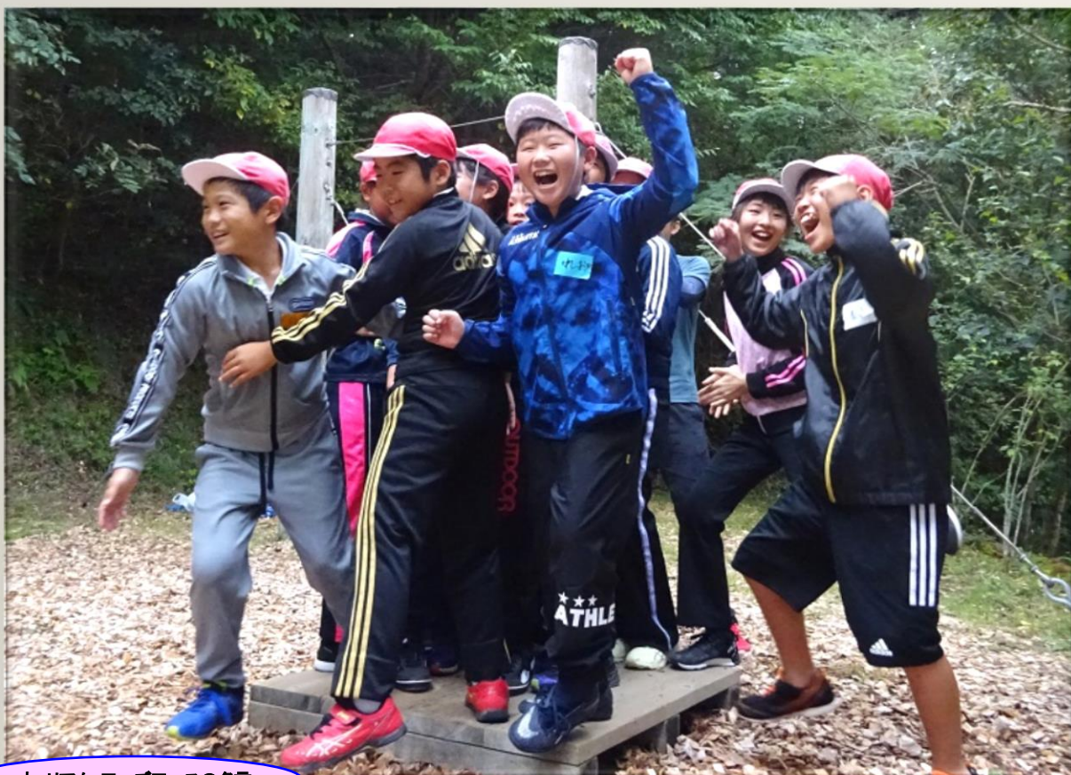
ウィリアム・ワーズワースの名言

「自然は、それを愛する者の心を裏切ることには決してない。」その言葉そのままに、曇天の天気予報を見事に覆し、満天の星(木星や土星までも)が現れました！自然の中で全プログラムを完璧にやり遂げた5年生のみんなに拍手！