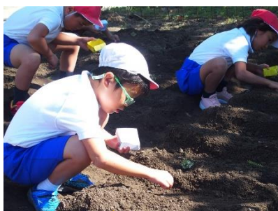
9/25 大根の植ええ2年 ご協力ありがとうございました!