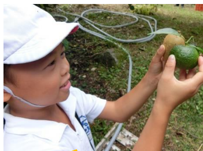
9/27 キウイ農園訪問 3年生の収穫まであと一歩!