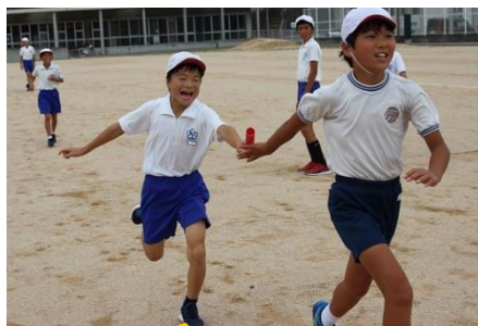
9/30 陸上競技合同練習 5・6年生が福賀小と猛特訓!