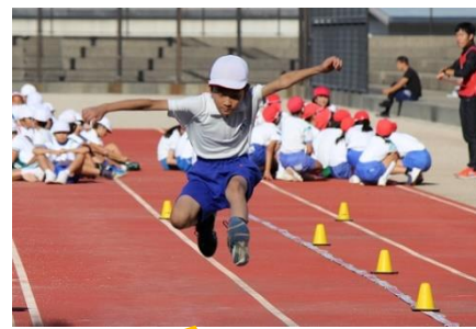
10/9 陸上競技大会5・6年 萩市との合同開催!

「舞の海」さんがやって来る! 日時: 11月23日(土)14:15 会場: 阿武町民センター ※ 阿武町「人権を考える集い 推進大会」で講演予定