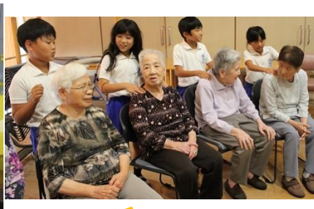
9/30 清光苑訪問4年 肩もみタイムが大好評!