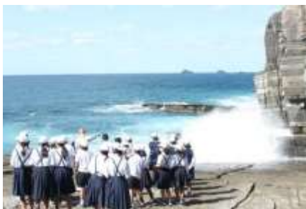
10/6 須佐ホルンフェルス 中学校理科の先生が指導