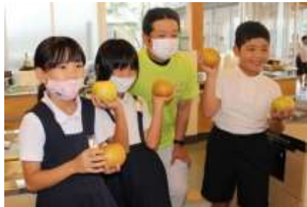
9/18 梨生産者給食交流 給食時間に子どもたちが質問攻め