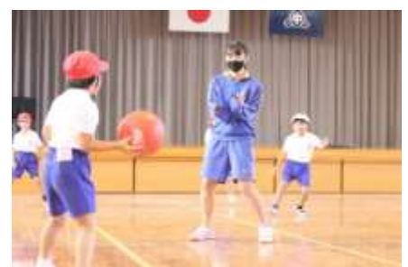
10/9 小中交流体育 小1と中3がボール投げあそび