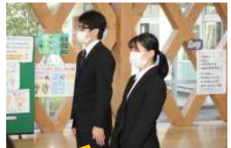
10/5 教育実習開始 地元出身学生さんを4・5年学級に