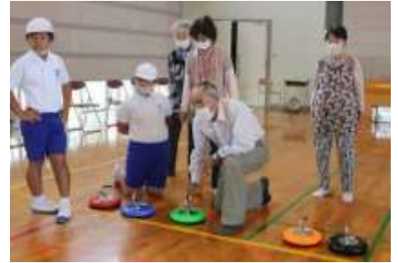
9/23 なごみ会との交流 カローリングが大好評！