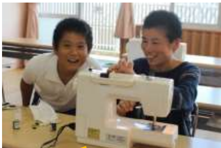
9/29 裁縫ボランティア 難関ミシンでナップサック！