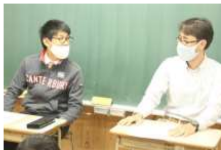
10/8 GPスマイル(心の学習) スクールカウンセラーさんが1年教室に