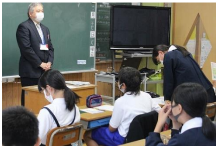
11/17 租税教室(6年) 指導は町戸籍税務課の方です！