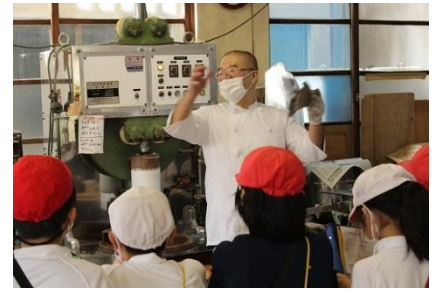
11/18 奈古浦深検(3年) 奈古浦リースもいよいよ完結！