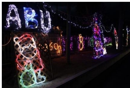
12/12 イルミネーション設置 今年も装飾で阿武町を元気に！