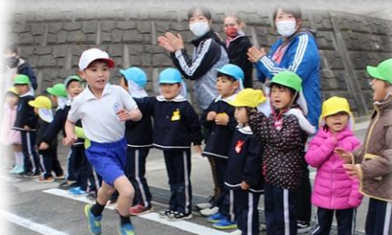
低学年男子1位 記録4分01秒 距離 1000m

みどり保育園の園児さんや保護者・地域の皆様 子どもたちへの大声援をありがとうございました！