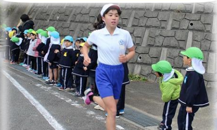
高学年女子1位 記録8分12秒 距離 2000m