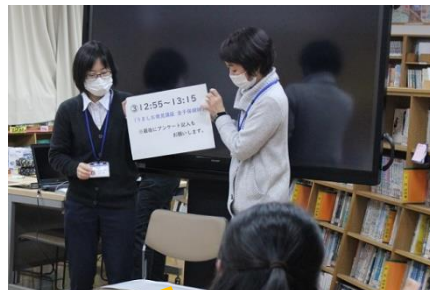
12/4 うましお講座 町健康福祉課とタイアップ！