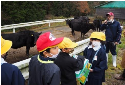
12/11 無角和牛の里(5年) 「無角和牛」研究も大詰め！