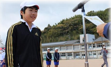
高学年男子1位 記録7分51秒 距離 2000m

今年から大会名を「阿武っ子ロードレース大会」とし、自分の記録更新に挑む気持ちや友達やライバルと競う姿勢を育てることに重点を置き、日常の「ラン RUN タイム」の在り方から見直しました。その結果、大きく記録を伸ばした成長株や念願の「第1位」に輝いた努力家の誕生といった充実感・達成感に満ち溢れた素晴らしい大会となりました。