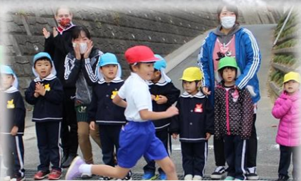
低学年女子1位 記録4分40秒 距離 1000m