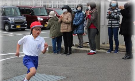
中学年男子1位 記録6分12秒 距離 1500m