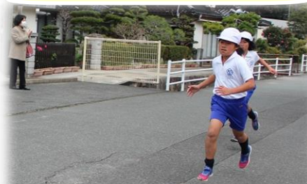
中学年女子1位 記録6分18秒 距離 1500m