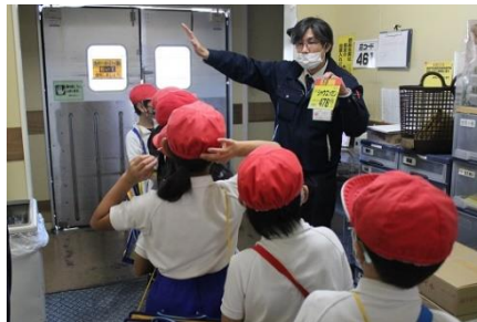
11/18 サンマート見学(2年) バックヤードを直撃取材！