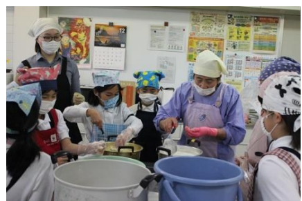
12/15 味噌・豆腐づくり(4年) 町農林水産課の事業の一環として！