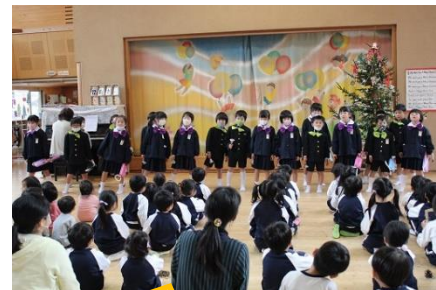
12/8 みどり保育園交流(1年) 成長した1年生の勇姿全開！