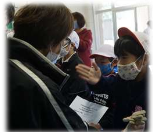
こんな家具を作りたい！森林教室でも話し合い！