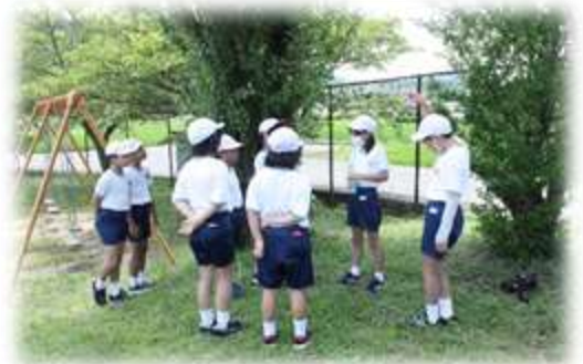
ププとの思い出づくりプロジェクト！遊びの計画も話し合い！