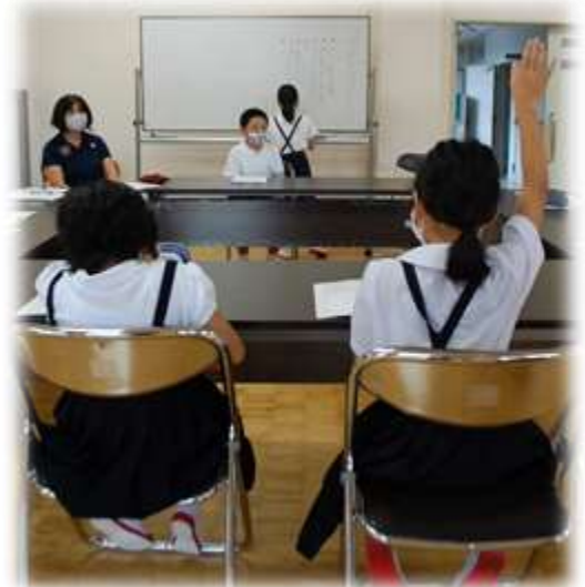
いらお苑訪問！コロナ禍、何ができるかな？児童会議で話し合い！