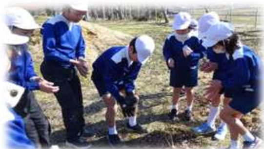
引っ越し成功に思わず拍手！！

「ププ jr」を新たに育てることを目指してポプラの野良生えの新芽を確保していました。移植をするなら暖くなる前にとの助言から子どもたちと一緒に場所を移動させました。根がしっかりとついてくれると良いのですが・・・。