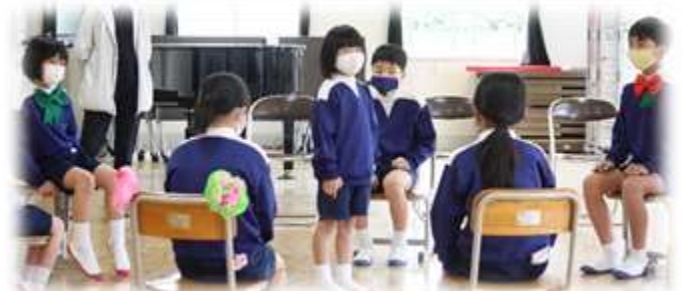
はじめての「フルーツバスケット」！ だんだんルールが分かってきて、1年生も楽しめたようです！