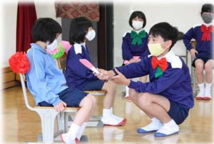
サイズが大きく異なる6年生が、腰をかがめて相手をしている姿が、とっても微笑ましかったです！！