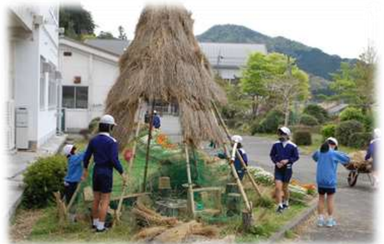
秘密基地1号（ワクワクハウス）も、次のリニューアルに向けて準備が進められています！