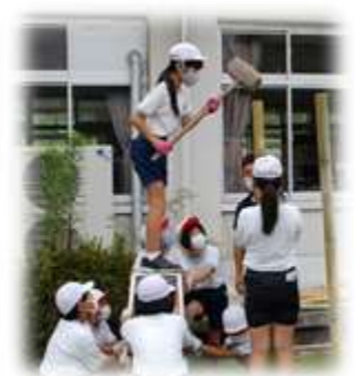
何とか、設計図通りの秘密基地になりそうです！