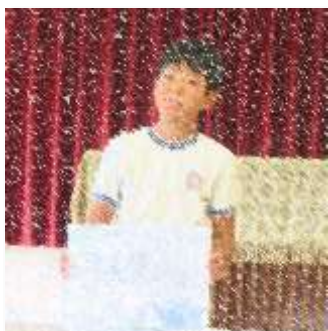
夏休み作品発表会 伝える!