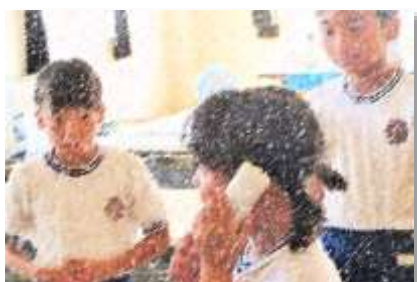
総合 外部の先生に依頼する!