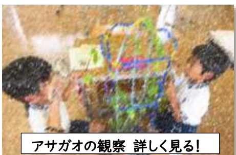
アサガオの観察 詳しく見る!