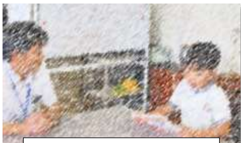
新聞づくり インタビューする!