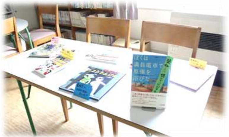
登校日に来てみると、皆へのメッセージつきで机に本が並んでいました！