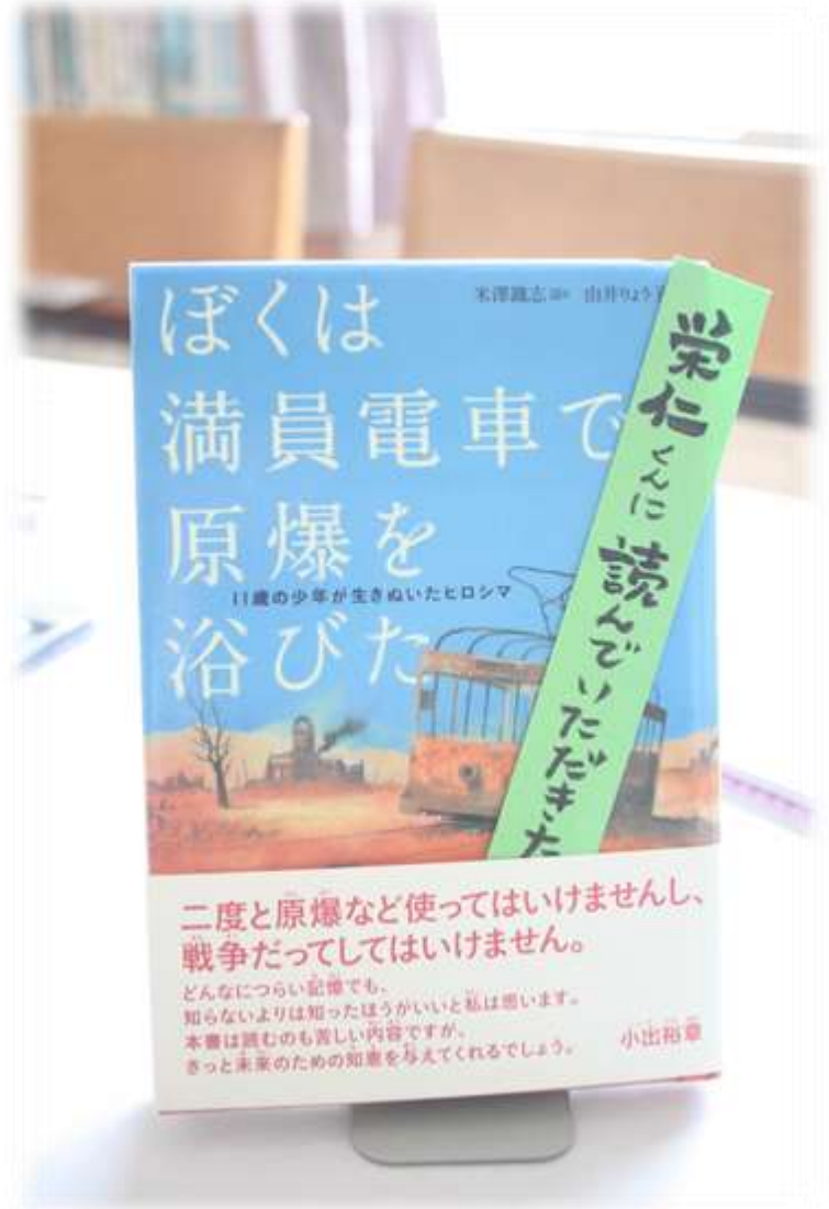
6年生の蟹谷くんへのお薦めの本！