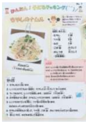
紹介していただいたレシピ

…こんな事態だからこそ いろいろな人たちに支えられているということに 改めて気づかされます！