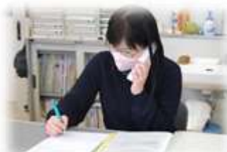
電話で確認、みんなは元気してるかな？