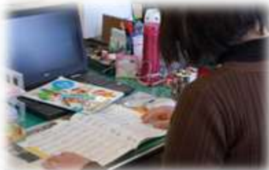
みんなが学校に来たときのために授業の準備！