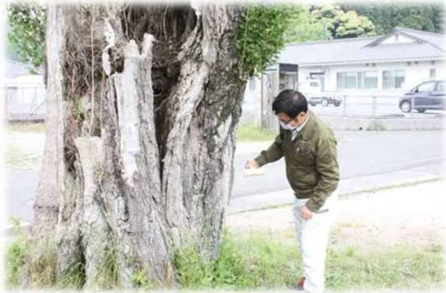
樹木医さんに診察していただいている様子

福賀小学校のシンボルツリー！ 3本のポプラの木！ 学校のマスコットキャラクター 「ポポ」「プブ」「ララ」も この3本の木から生まれました！