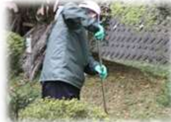
今年は何を植えるかな？ さあ畑を耕せ！