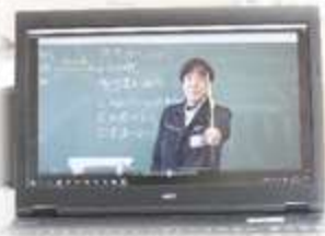
ビデオ授業にチャレンジしたぞ！