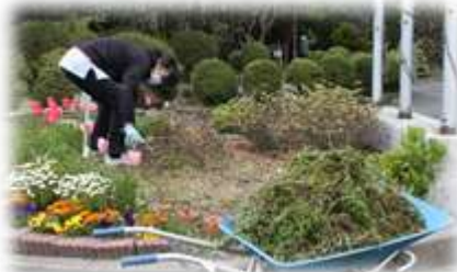
花壇や校庭をきれいにしておこう！