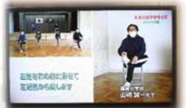
ケーブルテレビに出演したよ！