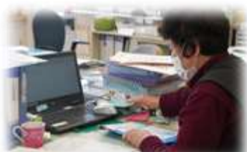
毎日コツコツ事務作業！