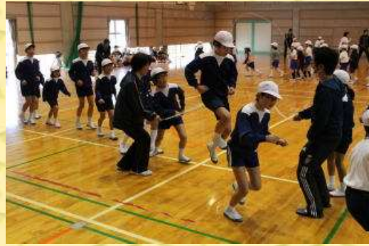
個人の持久跳びも、団体の8の字跳びも、よく頑張りました。