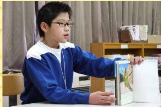
それぞれの本の魅力を熱弁しました。