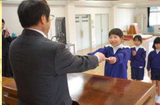
子ども達の成長が伝わったでしょうか。