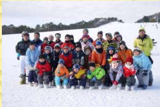
子ども達がとっても上手で驚きました。