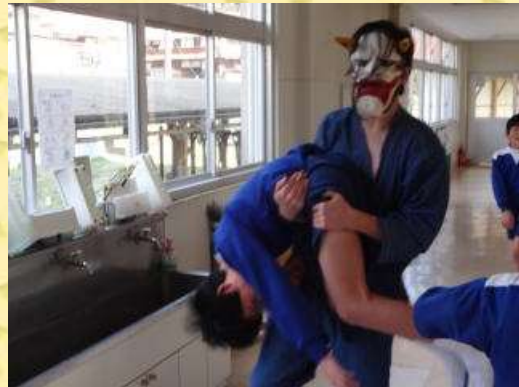
無事、鬼を撃退しました。